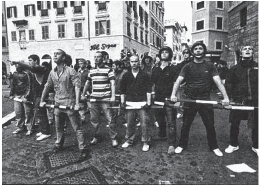
Squadre? Aufmarsch des Blocco studentesco

Gezielt werden auch die Frauen angesprochen, etwa mit der Initiative »Zeit, Mutter zu sein«, die sich für die Rechte von alleinerziehenden Müttern einsetzt. Die seit den neunziger Jahren angestiegene Masseneinwanderung nach Italien wird in den affinen Publikationen primär unter einem »globalisierungskritischen« Aspekt gesehen: der Kapitalismus brauche billige Arbeitskräfte und versuche diese Ausbeutungsstrategie mit multi-kulturalistischer Rhetorik zu kaschieren. Unter den Militanten sollen sich auch gelegentlich farbige Aktivisten einfinden, und zu den internen Legenden gehört die Geschichte von der Pizzeria eines Ägypters, die von Antifas verwüstet wurde, die es auf Gianluca Iannone abgesehen hatten – worauf dieser die Renovierung des Lokals durch ein Benefizkonzert unterstützte.