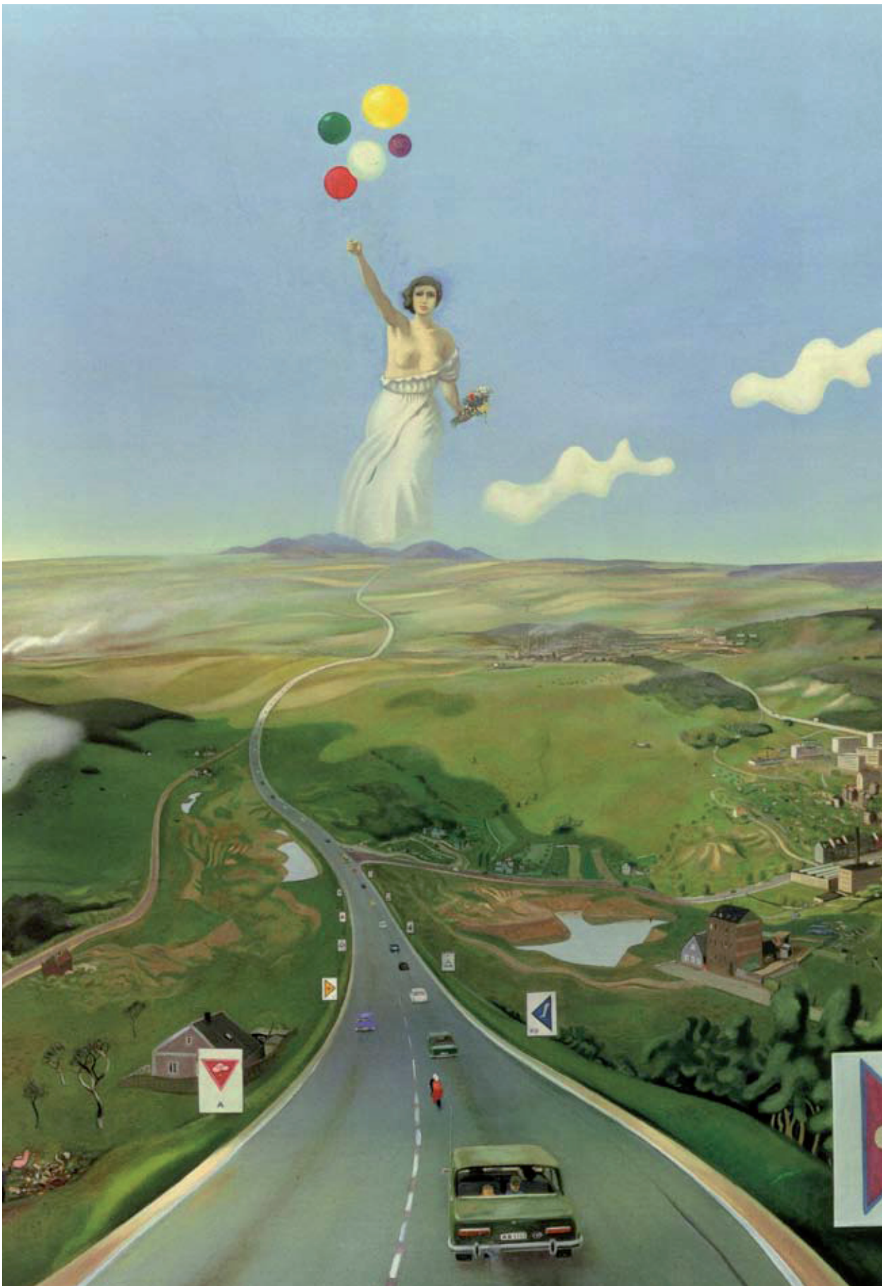
Hinter den sieben Bergen (1973)