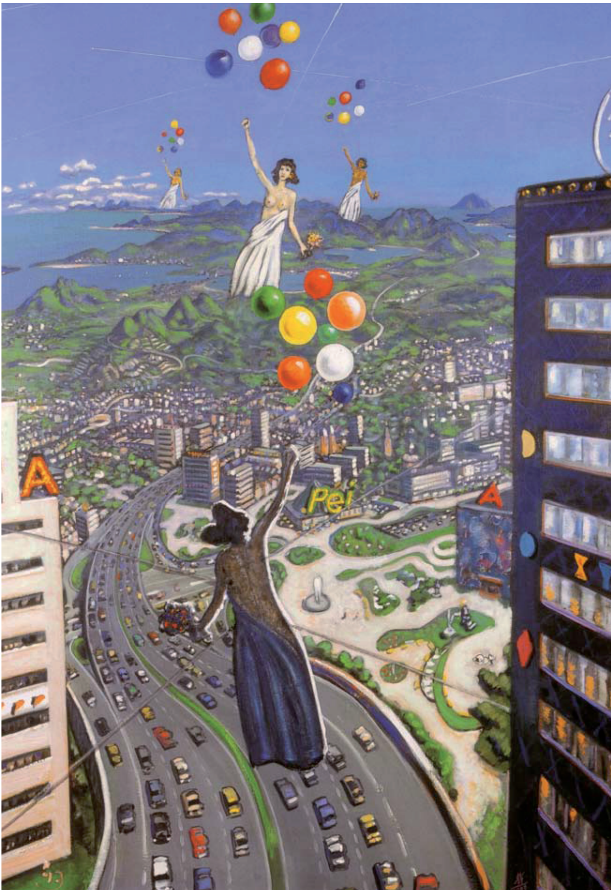
Hinter den 7x7 Bergen (1993)