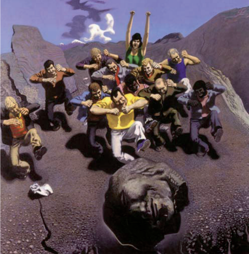
Der übermütige Sisyphos und die Seinen (1976)