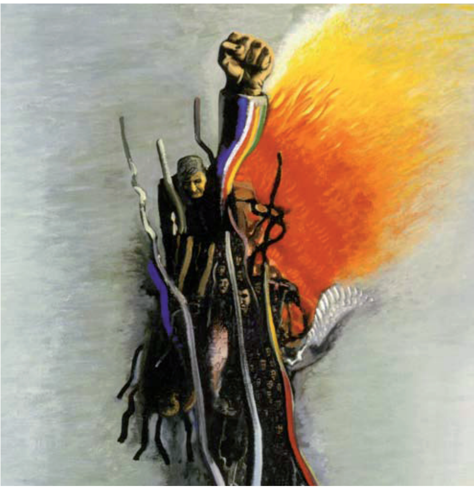
Und immer wieder: Trotz alledem! (1976)