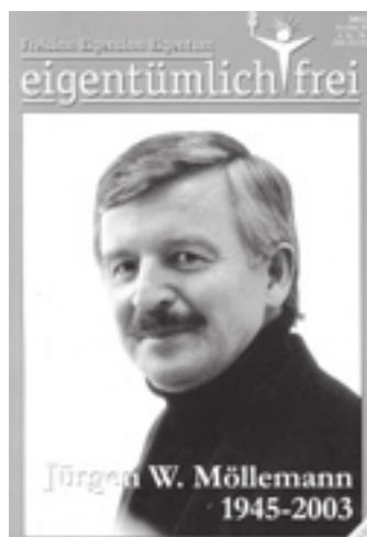
Was wäre möglich gewesen – Schwerpunktheft von eigentlich frei zu Möllemanns Tod