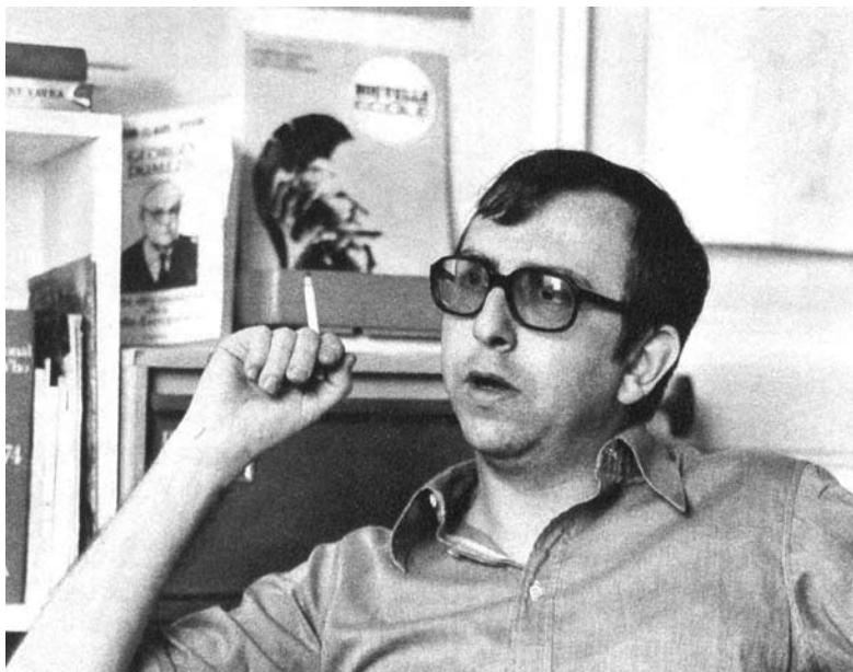
Alain de Benoist im Interview mit dem Spiegel, 1979.

Die Entstehung dieser Denkschule läßt sich auf Februar 1968 datieren, als – einige Monate vor den Ereignissen im Mai – die erste Ausgabe der Zeitschrift Nouvelle Ecole erschien. Ein Jahr danach wurde der Verband GRECE gegründet (Groupement de recherche et d'études pour la civilisa-