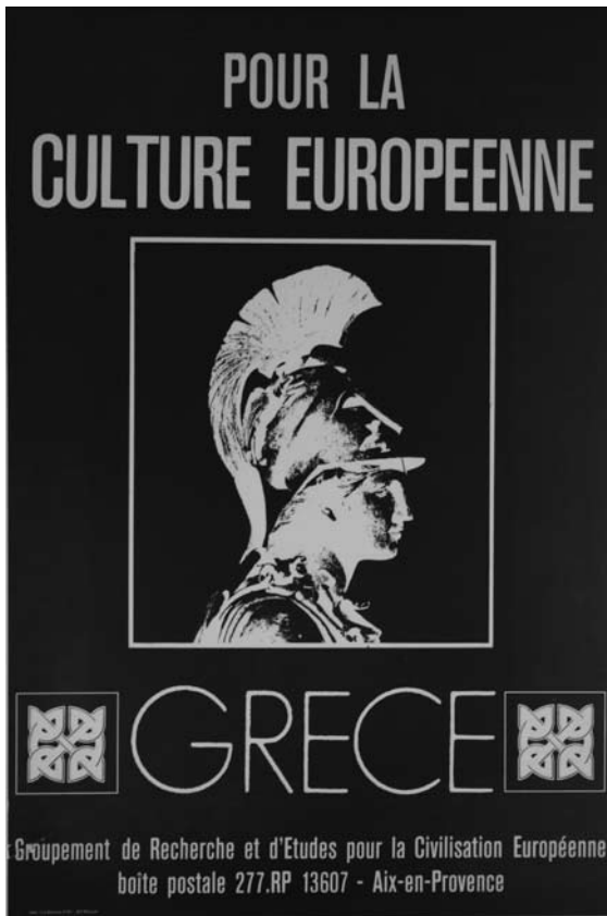
Plakat des GRECE, Ende der 1970er Jahre.

Zweifellos ist dies nicht der einzige Faktor. Manche der Angriffe gegen Louis Pauwels wegen seiner Verbindungen zur Nouvelle Droite richteten sich vermutlich indirekt auch gegen den Figaro -Inhaber Robert Hersant, dem vorgeworfen wurde, ein regelrechtes Presse-Imperium geschaffen zu haben (man nannte ihn den »papivore«, den Papierfresser), aber auch gegen den damaligen Staatspräsidenten Valéry Giscard d'Estaing, für den Pauwels gewisse freundschaftliche Gefühle hegte – nicht zufällig war er auf dem Titelblatt der ersten Ausgabe von Le Figaro-Magazine abgebildet.